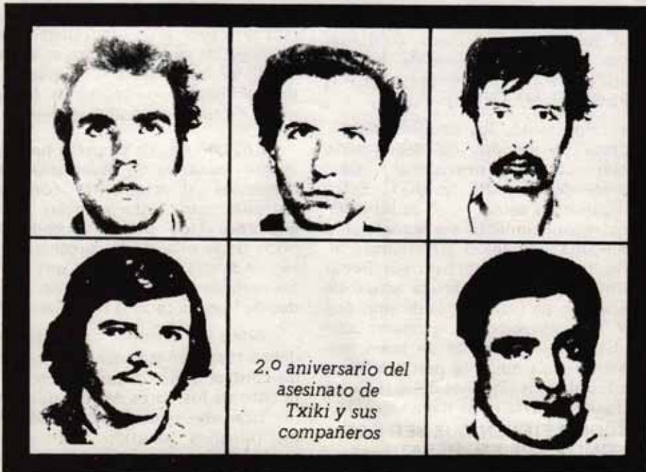
2.º aniversario del asesinato de Txiki y sus compañeros

La posición de nuestro partido en este tema, es diáfana y tiene una clara y sistemática continuidad. Estamos radicalmente en contra del terrorismo individual dirigido contra personajes, por mas relevantes que sean del estado burgués. En situación muy distinta a la de ahora nuestro partido se pronunció tajantemente contra el atentado a Carro Blanco y mas tarde lo ha hecho siempre contra acciones posteriores similares. Estos no son los métodos del proletariado revolucionario, pero por lo mismo, nos negamos a que se ponga en el mismo saco las acciones de bandas ligadas al estado burgués, alimentadas y promovidas por este contra los trabajadores, y las acciones que grupos equivocados en sus métodos, llevan adelante contra individuos de este estado que es en definitiva la fuente de la opresión y la explotación que lleva a algunos a los desesperados e ineficaces métodos del terrorismo.■