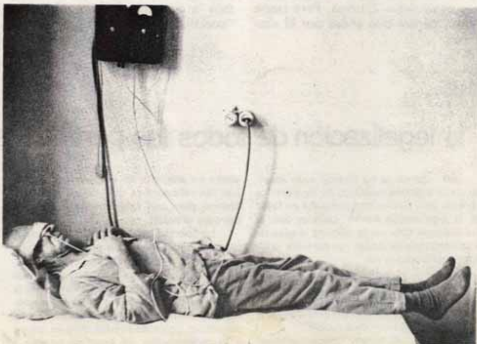
sesión de electroshock en un sanatorio psiquiátrico soviético