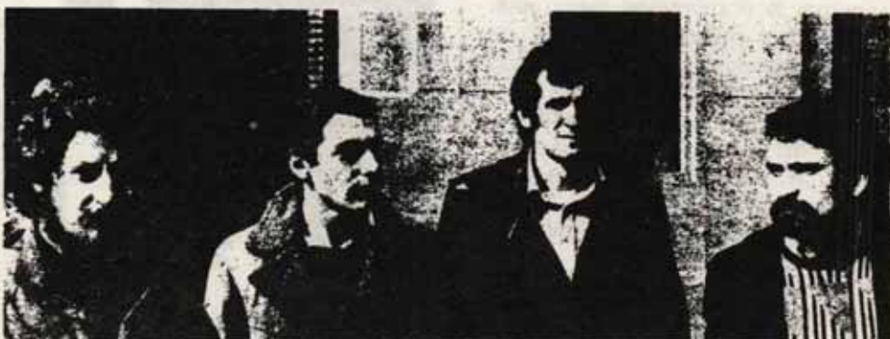
Representantes de la Liga Comunista abandonan el Ministerio de la Gobernación después de haber presentado la documentación correspondiente para su legalización.

Si este gobierno es antidemocrático, no se puede negociar con él la libertad. Desde hace más de dos