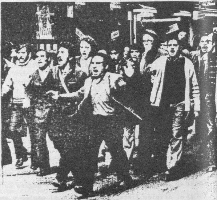
Una jornada que se puede convertir en Huelga General