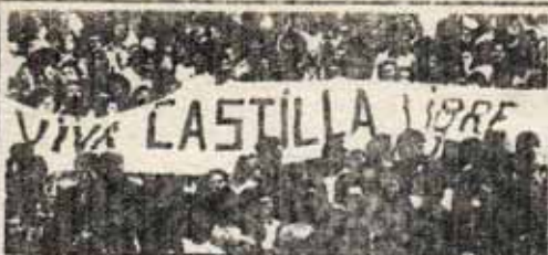
RECITAL DE LOS PUEBLOS IBERICOS