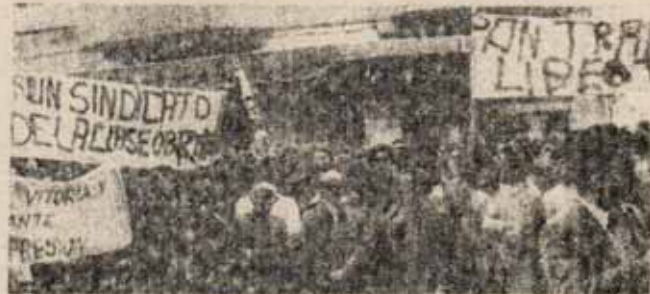
El deterioro de su imagen supondría la aceleración del fin de la dictadura.

Corroída por sus contradicciones internas, con la soga del movimiento de masas al cuello, la Dictadura es hoy incapaz de remodelar o renovar el Gobierno, sin el riesgo de una agudización del deteriorado cuadro de alianzas entre los diversos clanes franquistas. La crisis de Gobierno ataganta, es la más alta expresión de la crisis del Franquismo, de su inercia mortal.