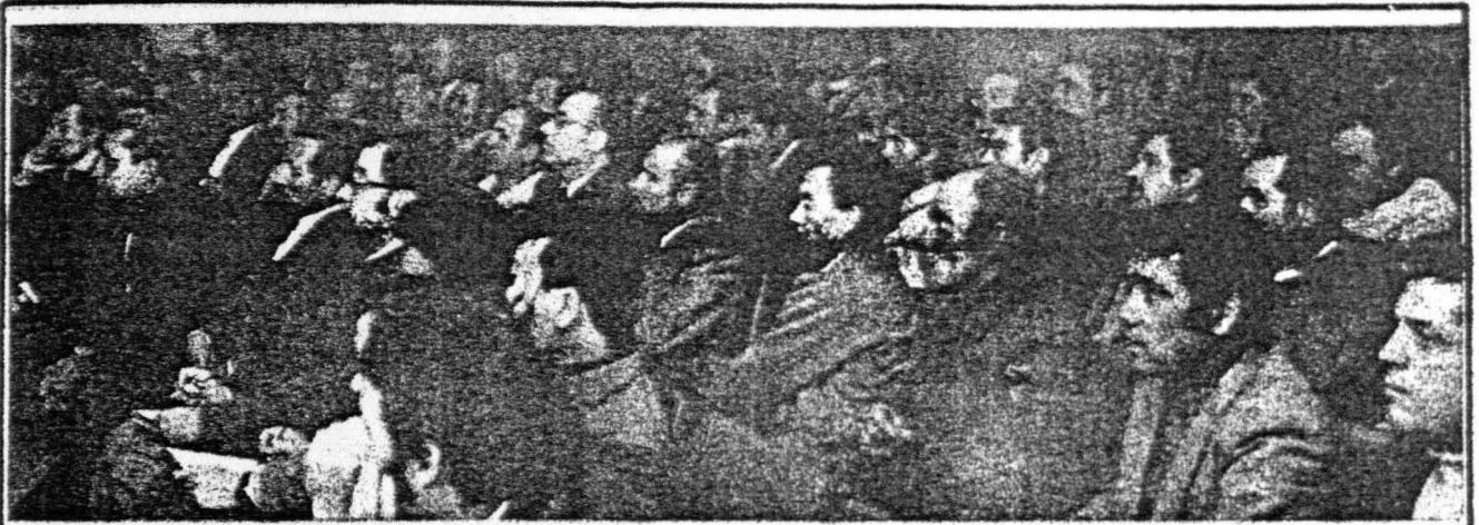
Asamblea de la Construcción

Los días 16 y 17 de Abril más de 10.000 obreros de la construcción han ido a la huelga en toda Barcelona. Tras un par de meses de relativa estabilidad en el frente de las luchas obreras, esta huelga ha marcado, junto a las luchas de Valladolid iniciadas poco después, el inicio de una nueva ofensiva obrera. La jornada de lucha del 16 fué convocada por las Comisiones Obreras del sector en apoyo de una plataforma de 19 puntos entre los que se incluían: Garantía de puesto de trabajo; Elevación general de salarios; Semana de 40 horas; Todos fijos a los 15 días; Amnistía, libertad para los detenidos y vuelta de los exiliados; Ningún trabajador, sea o no cargo sindical, podrá ser sancionado por defender los derechos de su clase; Derechos de huelga, reunión, asociación y expresión, etc. Al mismo tiempo, se llamaba a "elegir" una Comisión deliberadora para negociar un nuevo Convenio Colectivo, la cual debe ser libremente elegida en Asambleas por los trabajadores de la construcción, sean o no