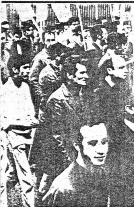
La ocupación de los talleres de montaje de FASA, ha abierto una nueva perspectiva a futuras luchas que se enfrenten al lock-out patronal...

Las responsabilidades de OICE hay que situarlas en