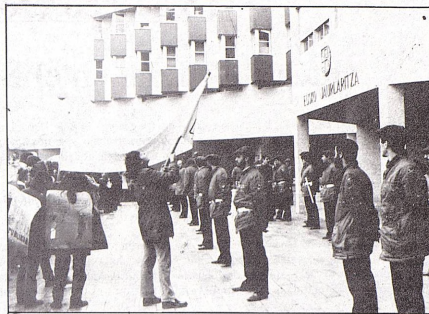
El Gobierno Vasco inauguró la Ertzaina contra los Maestros.

"negociación" y el Comité valorará la necesidad de presiones puntuales de cara a la misma, bien con paros, jornadas de lucha, manifestaciones, etc.