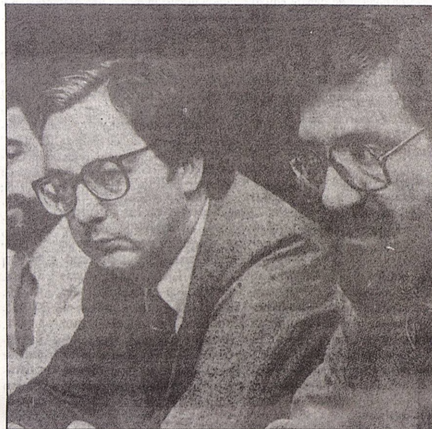
La Comisión Ejecutiva del PSE-PSOE reunida el día 14, dió el NO definitivo a la Mesa.

Ahalezkoa da "pakearen mahaian" gabrikotasuna lor dezala berriro; baina oraindik ez behintzat, orain aste batzuk herri langileen hainbeste espektatiba sortu zuenak, orain irten biderik gabe datza. Eta oraindik