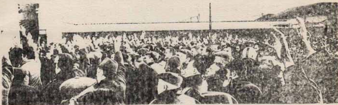
... formas de acción y organización independiente de masas, ...

Por otra parte, nuestro partido, a lo largo de dos años de lucha por superar la impotencia capituladora = de los falsos alternativos a la línea dominante en el movimiento obrero, ha concentrado esfuerzos en la plasmación del programa de acción que corresponde a esas exigencias. La experiencia de los pasos y los vacíos de nuestro esfuerzo, confrontado a las exigencias crecientes de la agudización de la lucha de clases, nos ha obligado no sólo a precisar el contenido de ese programa de acción, sino a dotar su impulso de mediaciones necesarias.