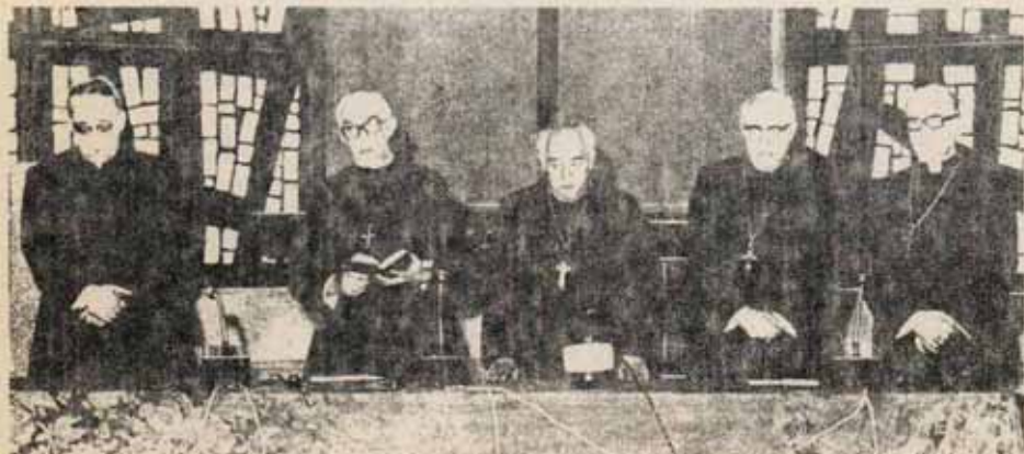
Las campañas de la Iglesia sobre amnistía... tampoco dan la talla.

--El mismo deterioro del franquismo que le impide ampliar realmente el juego político legal se expresa en una rigidez creciente de los mecanismos de ajuste entre las diversas componentes del Régimen con los que el bonaparte Franco ha ido manteniendo el equilibrio entre ellas. Durante todo el año han sido evi-