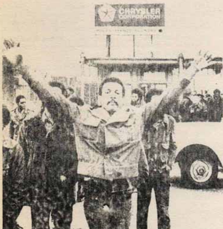
La crisis del capitalismo internacional bambolea (...) a los propios Estados Unidos

En junio, Arias afirmó que "hemos superado los peores momentos" que el Gobierno mantendría el nivel de empleo y terminaría con la inflación. Y ha sido precisamente en los meses siguientes cuando la crisis -inflación y estancamiento- ha hecho furor. Hoy hay que afirmar que los momentos peores todavía están por venir si el proletariado no lo impide. La crisis es incontrolable para el Gobierno Arias como para todos los gobiernos burgueses del mundo. Cuando hoy ese Gobierno dice que en 1975 va a relanzar la producción, va a impedir que el paro sea superior al 24, va a rebojar en 4 puntos el alza del coste de la vida, esas palabras son promesas vanas.