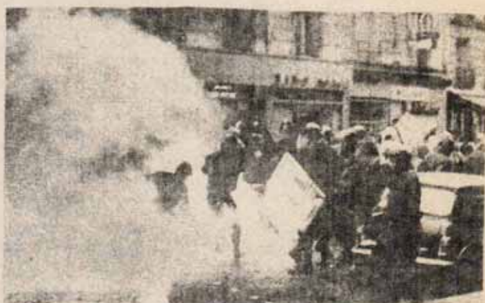
Más que nunca, los monopolios y su Gobierno se apoyan en los cuerpos represivos.

En efecto: más que nunca, los monopolios y su Gobierno se apoyan en los cuerpos represivos, pero esto pone en peligro cada vez mayor el intento de preservar al Ejército de la intervención directa contra las masas. A medida que esta perspectiva se perfila, se esbo-