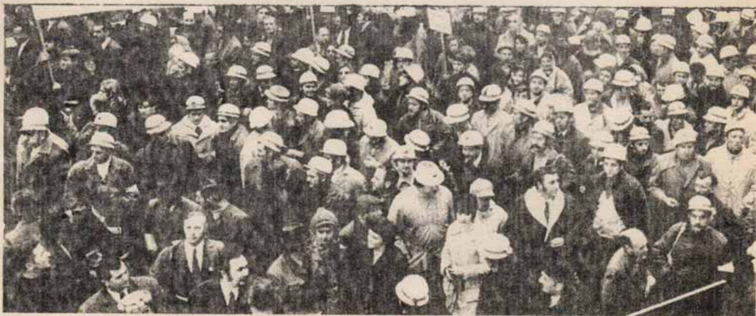
Es insoportable... la degradación de las condiciones de trabajo y de vida...

—es insoportable la cadena de ataques que tras varios años de degradación de las condiciones de trabajo y de vida comportan nuevos trallazos del alza del coste de la vida, desbordando ampliamente los salarios impuestos por los convenios de la patronal y de la CNS; las reestructuraciones de plantilla, el creci-