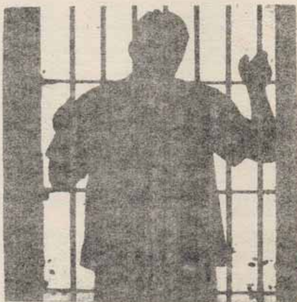
Disolución de cuerpos represivos...

La actitud ultrasectaria de los "Comités de Empresa" de Guipuzcoa (dirigidos por los NOC) en su absurda negativa a integrarse al poderoso movimiento de unificación de las CC.OO., en nombre de vagos principios "anticapitalistas" y "antirrevolucionarios", es igualmente un grave atentado a las actuales exigencias del movimiento obrero y popular. La postura mantenida por la dirección de estos "comités" en Rentería, donde son hegemónicos, abandonando de manera total al movimiento desatado en la Huelga General, y abortando ésta, así mismo, liquidadora.