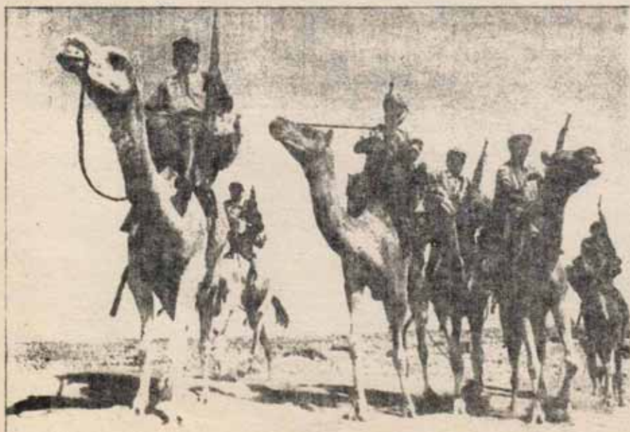
Independencia inmediata e incondicional del Sahara

Pero este proceso no hay que plantearlo desde el punto de vista estrecho de cada ramo, sector... Las CC.OO. y organismos similares sólo se pueden desarrollar impulsando la lucha eficazmente, es decir, impulsando la generalización de las luchas. Por lo tanto, lo que planteamos debería hacer la Coordinadora General y la fracción del PCE para unificar, construir, reconstruir el movimiento obrero, pasaría por coordinar desde el principio a las CC.OO. con los organismos de lucha de otros campos, para llevar a la práctica el plan de defensa que proponemos. Y la tendencia clasista debe promover, desde el primer momento, todos los pasos posibles en esa coordinación intersectorial para el avance en la plasmación de ese plan en la acción de masas. Esto incluye, por ejemplo, coordinar para acciones concretas incluso a fragmentos del movimiento obrero con fragmentos de movimientos organizados de la juventud u otros oprimidos.