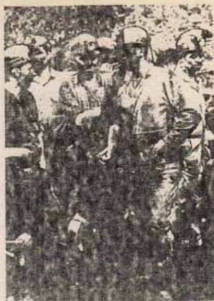
Trabajadores con duras condiciones de trabajo... aportan batallones radicalizados al combate

En consecuencia, a través de estas luchas pugnan = por abrirse paso los OBJETIVOS UNIFICADORES de todo el proletariado y de toda la población oprimida, a pesar de las divisiones que el enemigo de clase intenta man- tener y a las que colabora la línea de las direcciones reformistas del movimiento obrero. La tendencia a po-