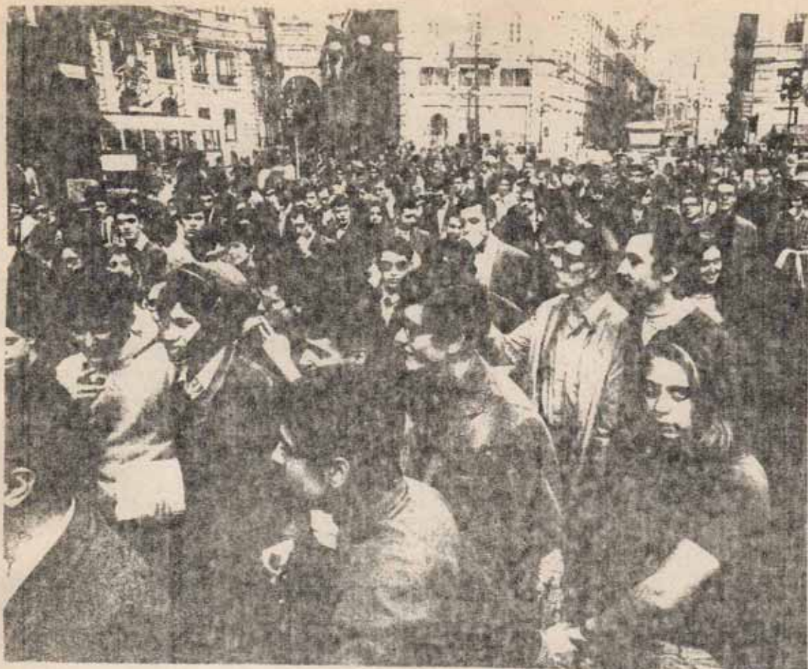
...la participación destacada de la juventud (...) en acciones conjuntas con la clase obrera...

Lo tónico general de las acciones de la juventud = son los objetivos del conjunto de la población oprimida con la clase obrera y las formas de acción directa: asambleas, desalojos, salidas hacia otros cuartos, manifestaciones, elección en puntos diversos de Comités = para organizar la acción y conjuntar fuerzas con el = proletariado. El surgimiento de una amplia franja de luchadores en esas acciones decidida a impulsar la lucha, en pugna con la orientación liquidadora, constituye un punto de apoyo importante para favorecer y potenciar cualquier paso en la generalización.