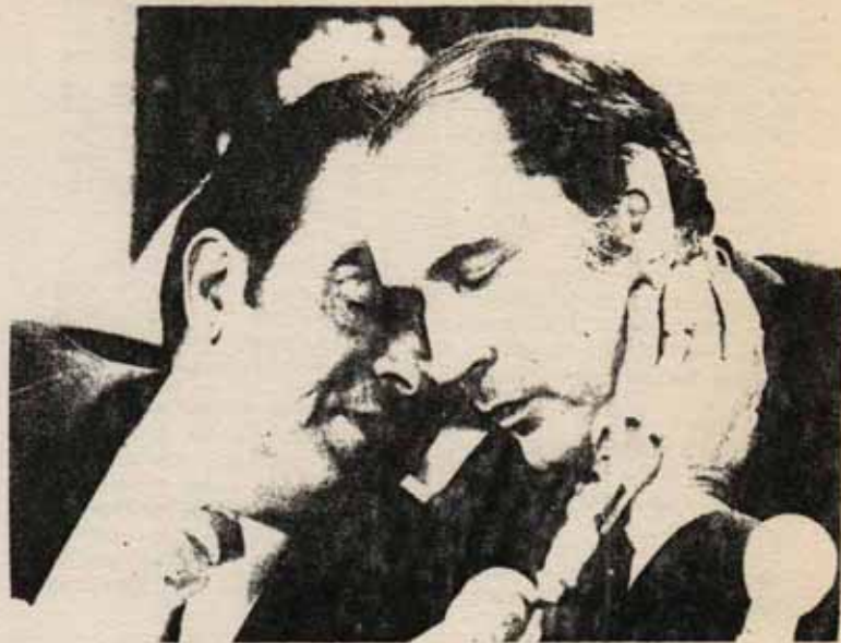
MM. GEORGES MARCHAIS FRANÇOIS MITTERRAND.

Más tarde, tras la II Guerra Mundial, el PC-entro en el gobierno de De Gaulle. De esta forma los stalinistas impidieron que un ascenso masivo de los obreros se transformase en una revolución socialista. Frente a las huelgas de masas y ocupaciones, cuando el movimiento de la resistencia -compuesto en su mayor parte por obreros- era la única fuerza armada en el país, el PC ayudó a las clases dominantes a darle la vuelta a la situación, desarmando a los obreros y arrancando de la lucha obrera todo el impulso y la confianza en las propias fuerzas.