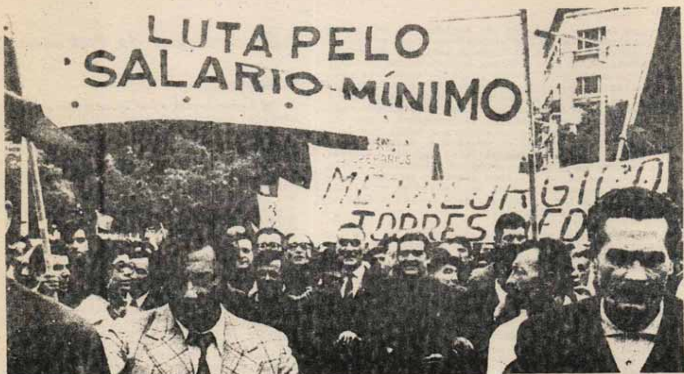
Manifestación del 1º de Mayo en Lisboa

tas de un sindicalismo respetuoso de sus normas: « subordinado al Estado burgués. Sin embargo, aunque no se contrapongan conscientemente al orden de los capitalistas que ahora representa Spínola, los pasos en la movilización independiente y la autoorganización son importantes. La puesta en pie de sindicatos como esa Intersindical que agrupa a más de 1.000.000 de trabajadores, el recurso generalizado a la huelga, la confraternización de la tropa con el proletariado y el pueblo, la solidaridad a flor de piel entre los más diversos sectores oprimidos tienen ya un carácter de clase inaceptable para la Junta. Esta aparenta dirigir lo que no controla y pronto empieza a hablar de manifestaciones de « caos y anarquía » reconociendo que las masas se están haciendo peligrosamente de su « orden ». En particular, la oleada huelguística marca una clara división, y las huelgas de hambre y enfrentamientos entre tropa y oficiales inquietan a la burguesía. « Con la primera huelga a escala nacional -superando la dispersión de los primeros momentos- que es la de Correos y Comunicaciones, las ilusiones ingenuas empiezan a henderse: la Junta da orden al Ejército de estar dispuesto a intervenir contra los trabajadores.