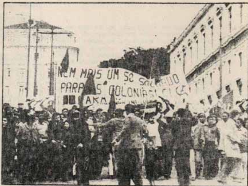
Manifestación de trabajadores africanos inmigrados

ción de los fines de los capitalistas(...) la confianza en los capitalistas", Lenin planteaba la "ruptura con los capitalistas, la desconfianza hacia ellos, el poner freno a su vil codicia y terminar con sus ganancias... la confianza en las clases oprimidas y, sobre todo, en los obreros de todos los países".