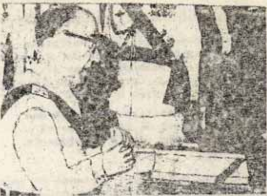
Carrero juró el cargo.

Carrero continuó la agravación de la crisis del franquismo.