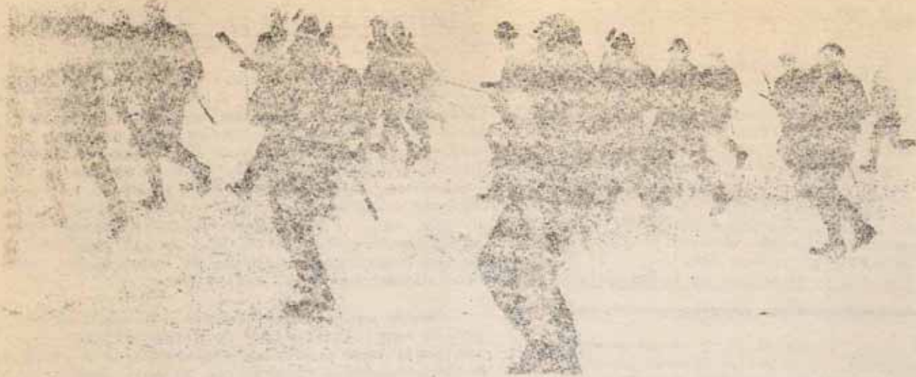
pompiera. la policía car- ga contra los manifestantes

... es activo de otro estrofo parte cada su in- ... (continúa).