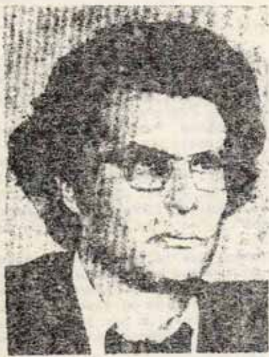
Alain Krivine, dirigente de la LIGUE COMMUNISTE

que pretendiese reconstruir la Ligue con otra apariencia sería arrestado inmediatamente. Esa es la intención del gobierno.