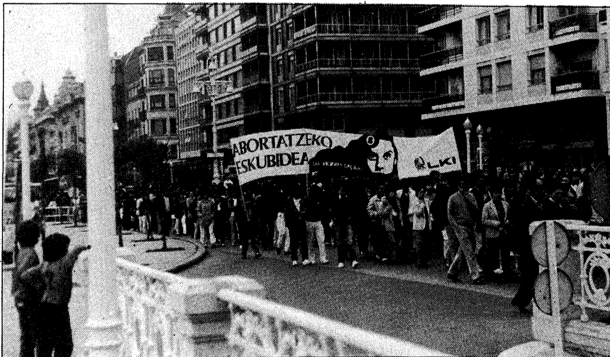
Desde que fueron detenidas, en octubre de 1976, las once mujeres de Bilbao, el movimiento feminista en Euskadi se ha consolidado en torno a este eterno proceso.

26 de Octubre de 1979: Primera suspensión del juicio. Se hace entrega al juez de 25.000 firmas exigiendo el derecho al aborto. En las puertas de los juzgados se concentraron más de 2.000 personas, incluyendo 50 abogadas y abogados procedentes de todo el Estado español. Además habían asistido diputados del PSOE y del PCE. Los ac-