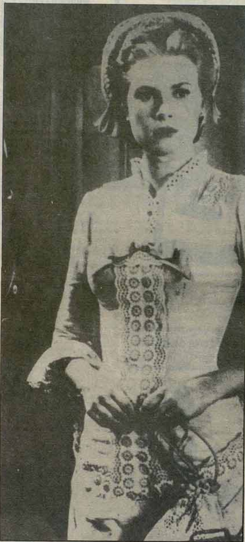
Grace Kelly en una secuencia de "Solo ante el peligro". Sus compañeras de Hollywood no le guardan mucho cariño: "la niña granjera y trepadora" la llaman.

No supuso éste un serio obstáculo en la carrera de Grace Kelly. Muy al contrario. El haber sido "partenaire" de Gary Cooper y, después, rival irreconciliable de Ava Gardner, hizo posible que Alfred Hitchcock diera con la "piedra filosofal" de su fértil imagina-