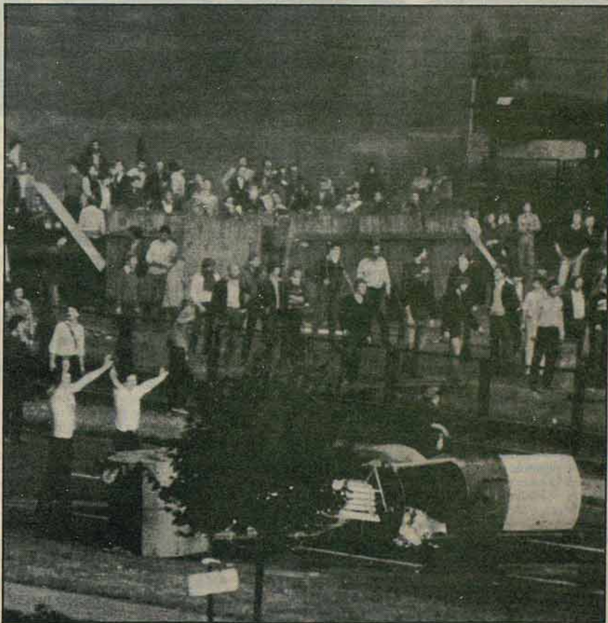
Los miembros de Solidaridad vieron frustrados casi todos los intentos de manifestación pacífica.

movimiento que se plantean en la declaración de la TKK parecen efectivas. Algunos responsables de la prensa clandestina afirman, en cambio, que «hasta ahora, la organización de la actividad en las