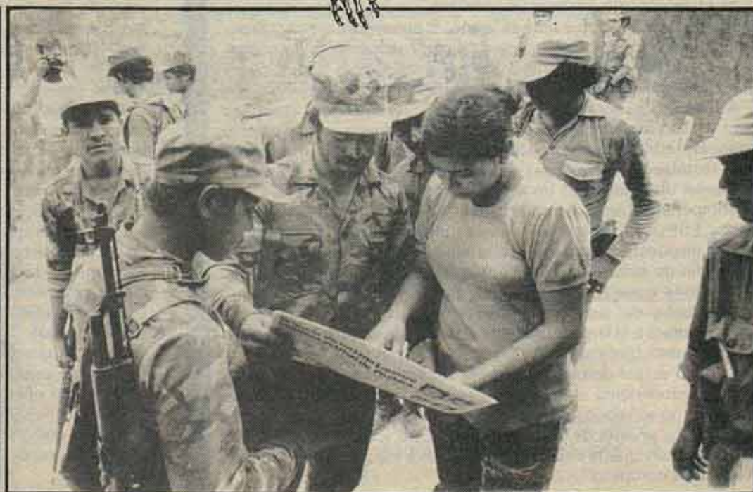
Milicianos/as en la frontera.