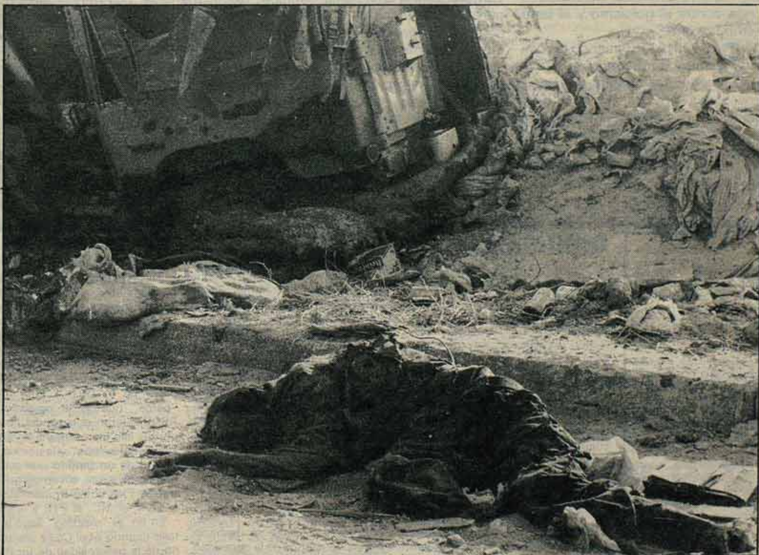
La muerte es el precio en la lucha por la tierra. ¿Acaso hay alguna diferencia con los métodos de los campos nazis de exterminio?