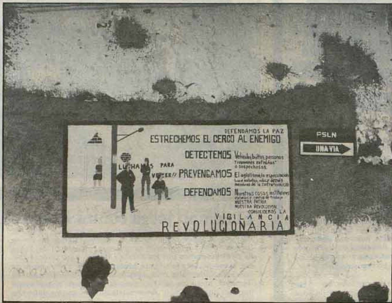
Cartel sobre la vigilancia revolucionaria.

Y si antes nos sentíamos optimistas y sandinistas, ahora lo somos más. En la celebración del 1er. aniversario estábamos sorprendidos al ver desfilar ya a 100.000 milicianos, saludando a Fidel y a los centenares de miles congregados en la plaza del 19 de julio. Más sorprendidos estábamos en el segundo aniversario cuando Daniel Ortega en nombre de la Junta y pasando de formalismos afirmó que las reglas del juego las dictaba el pueblo y por tanto se aprobaron en la misma concentración por aclamación una serie de decretos confiscando tierras y fábricas a los descapitalizadores y contrarrevolucionarios. Y cuando en el tercer aniversario se daban las cifras que hemos señalado antes nos sentíamos satisfechos, no sólo porque era una concreción máxima del trabajo desarrollado por los sandinistas, no sólo porque representaba en la práctica muchas cosas que hemos leído en los libros de los clásicos o que hemos soñado repetidamente, sino también porque nos dábamos cuenta de que no hay fuerzas capaces de detener este proceso, no hay suficientes marines ni similares que puedan romper la voluntad de un pueblo organizado, consciente de sus intereses y de sus objetivos, que ha pasado y está dispuesto a pasar por encima de todas las dificultades a que se verá confrontado, y que por cierto son enormes, como explicaremos el próximo día. Ah!, pero recordemos que optimistas y sandinistas no quiere decir que bajemos la guardia, porque Reagan es algo más que un payaso, es también un pistolero. □