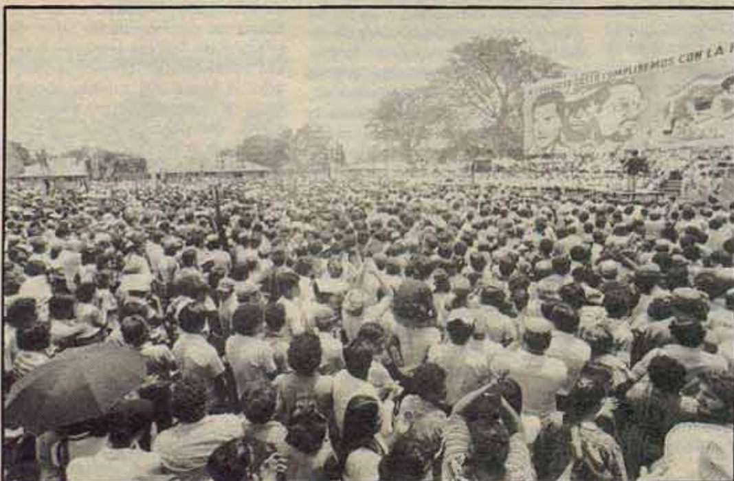
Aspecto de la mani del 19 de julio 82.