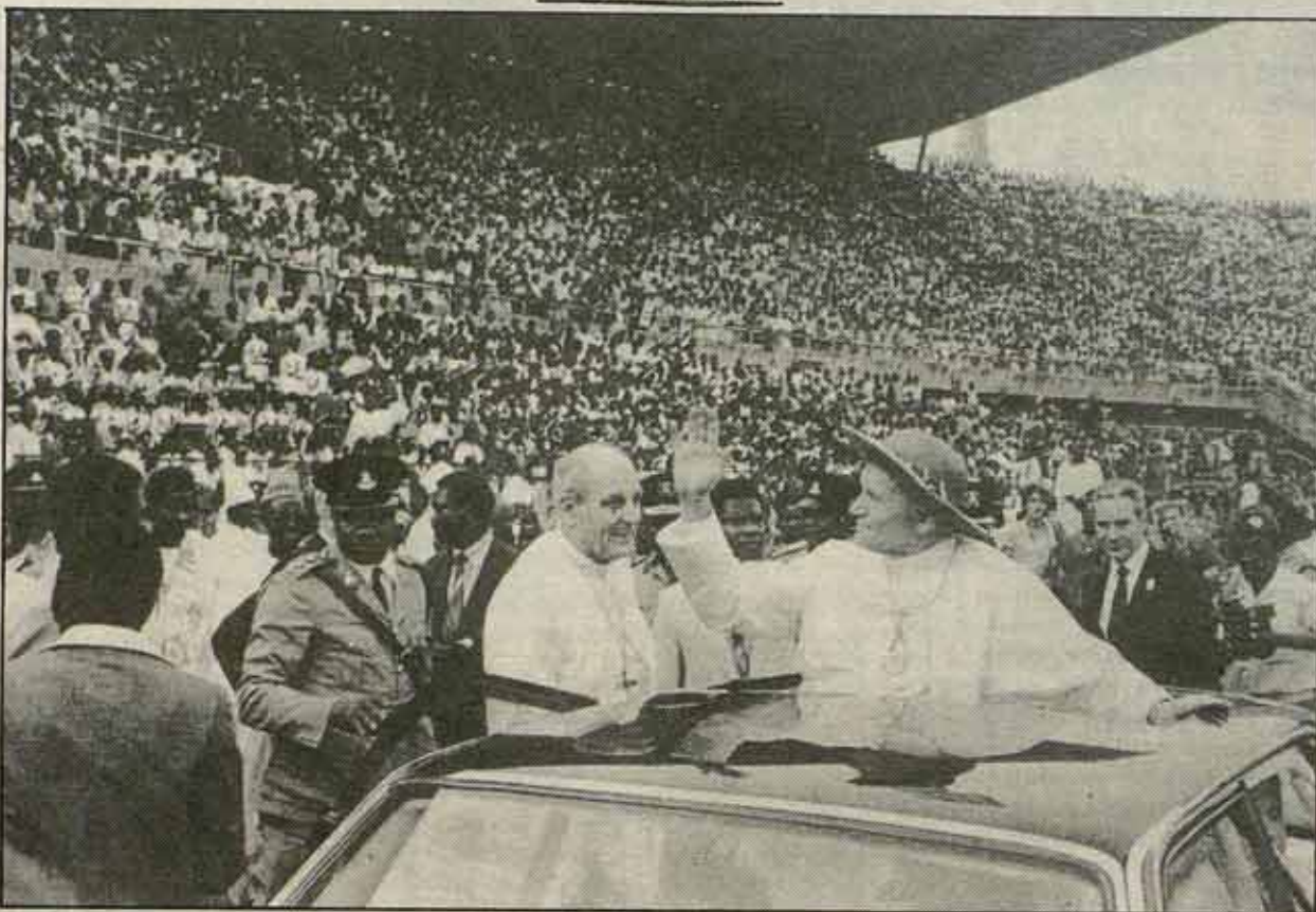
Juan Pablo II en Lagos (Nigeria); a su derecha, su socio Marcinkus.