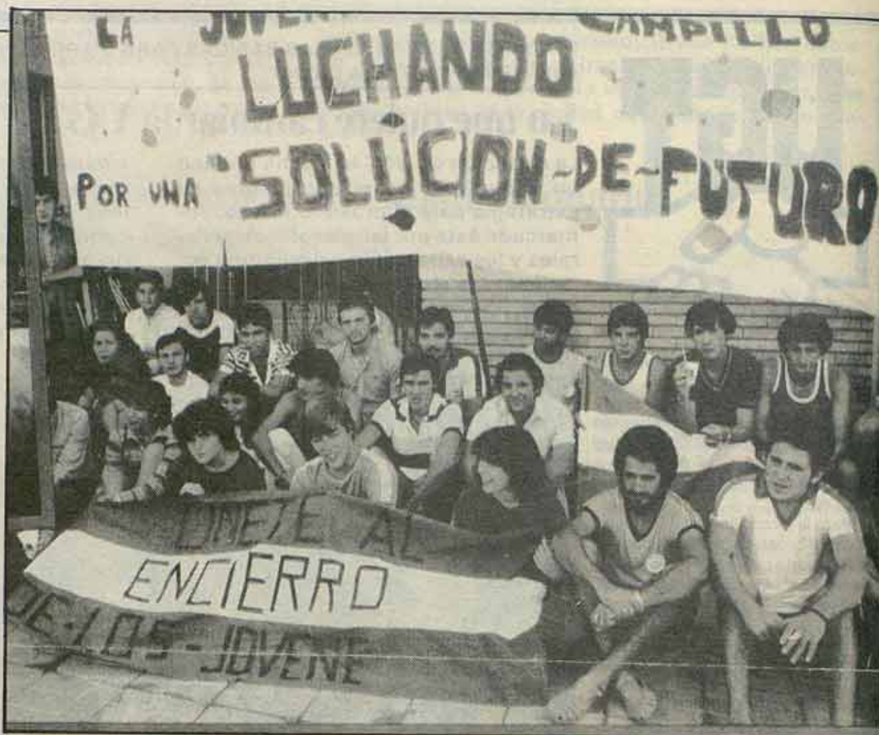
2.500 personas recibieron en Huelva a la "MARCHA de los JOVENES".

(*) Nota de la redacción: En el pasado número de Combate , el duende de la imprenta, que como nosotros tiene unas enormes ganas de que las movilizaciones de la cuenca minera sean lo más amplias posibles, nos jugó una mala pasada. Como los lectores habrán podido comprender, no fueron 75.000 los manifestantes, sino 25.000, una cantidad bastante respetable sin necesidad de que nuestro amigo el duende tenga que exagerarla. Si la empresa sigue en sus trece habrá que ir a por lo que dice el duende.