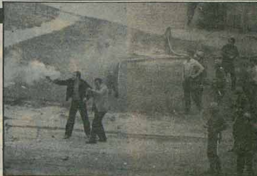
La policía política secreta dispara contra los manifestantes. Asesinaría a varios de ellos.

ha reconocido que «una de las razones de la situación» —léase las manifestaciones del 31— «hay que buscarla en la disminución de los salarios reales» . Y nadie cree ya en las promesas de la Junta de levantar el estado de guerra, tras la oleada represiva del 31 de agosto.