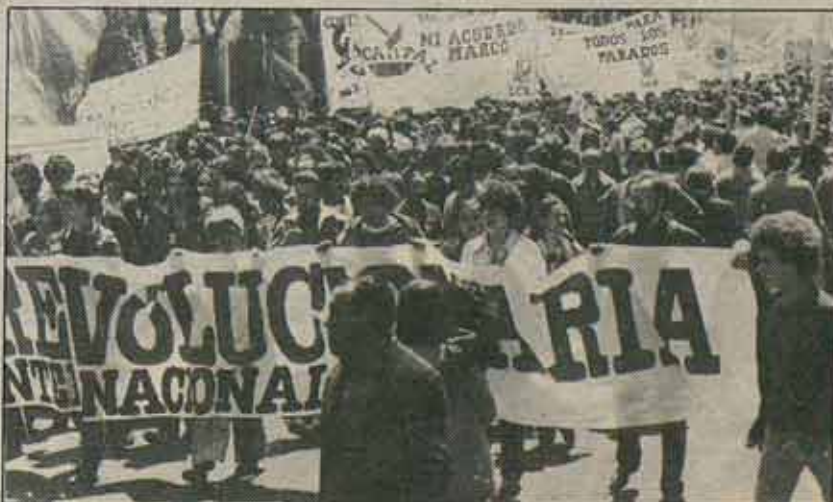
La LCR se presenta en coalición en 18 provincias y en solitario en otras 30 más.

La campaña será "movida". Os iremos informando, mejor o peor según la cantidad y la puntualidad con que vosotros mismos informeis a Combate. □