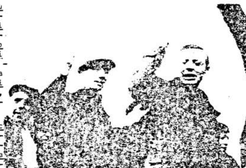
La clase obrera esta comprendiendo que solo encontrara solución a sus problemas a través de su propia fuerza y organizacion....

A la vez la dinámica del proceso que se está desarrollando no deja apenas lugar para el crecimiento de una conciencia reformista en la clase obrera en el sentido de confiar en el perfeccionamiento de la dictadura y sus cauces. El desbordamiento de los mismos se hace por la vía de la acción directa de masas (huelgas, manifestación...) creando los propios organos de combate (Asambleas, y Comités) y exigiendo el desarrollo de formas de autodefensa . La clase obrera se esta educando en el sentido de que solo puede encontrar solución a sus problemas